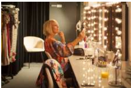
Lilla scenlogen – vid scenen, för snabba byten