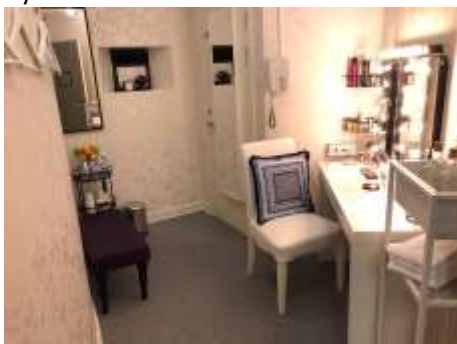
Sminkbord, toalett, kaffemaskin.